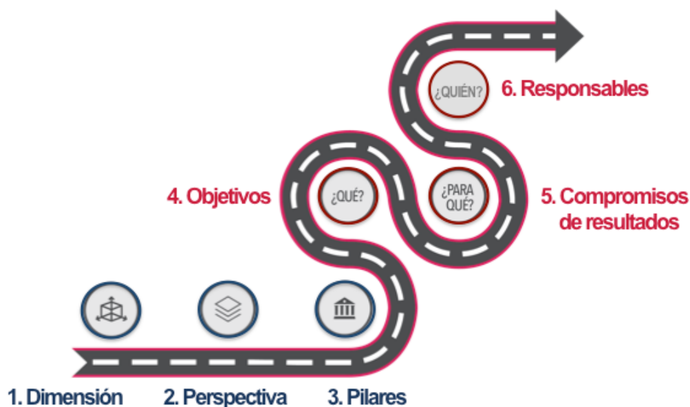
Figura 3. Ruta de construcción de compromisos del Plan de Acción Estratégico.